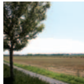
Plaine des Périseaux

La Résidence s'ouvre sur la plaine des Périseaux , parc de plusieurs hectares, un espace de respiration préservé , qui sera aménagé en vue de privilégier les activités de détente, un lieu de promenade pour les amoureux de la nature.