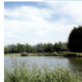
Étang de Faches